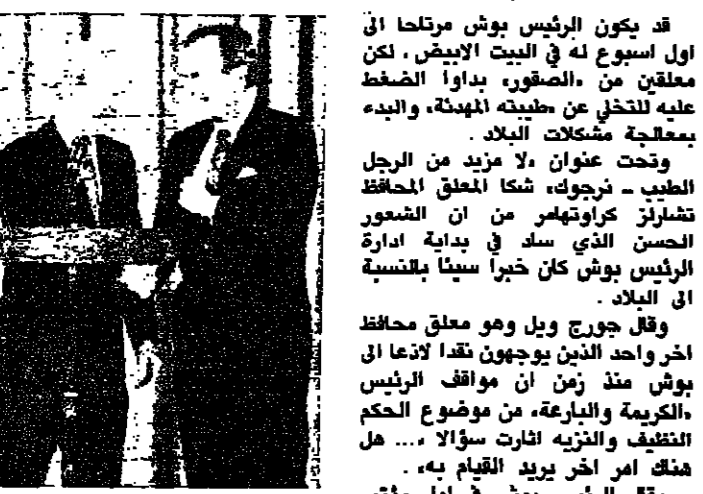
بوش يهني، جيسيس بيكر بعد تايته اليمين الدستورية

قد يكون الرئيس بوش مرتكبا إلى اول اسبوع له في البيت الأبيض، لكن معلقين من الضفوف، بدأوا الضغط عليه للتخلي عن طبيته الهيمنة، والبدء بمعالجة مشكلات البلاد. وتحت عنوان «لا مزيد من الرجل الطيب - نرجوه»، شكك المعلق المحافظ تشارلز كراوتهامر من ان الشعور الحسن الذي سد في بداية ادارة الرئيس بوش كان خيرا سينا فلسفية ان البلاد. وقال جورج ويل وهو معلق محافظ آخر واحد الذين يوجهون نقدا لاذعا إلى بوش منذ زمن ان موضوع الحكم الكريمة والبارعة، من موضوع الحكم التنظيف والتزينة اذرت سؤالاً... هل هناك امر آخر يريد القيام به. وقال الرئيس بوش في اول مؤتمر صحافي له أمس الاول انه على استعداد للتحرك مع القيادة الجديدة، وأنه يدرك تماما للمخاطر التي ستواجهه. ومضى الرئيس بوش يقول ان الشعب الأميركي يدرك أنه من الحكمة، في أمور مثل مسألة السياسة الخارجية أن يعرض - (الأسنان) الامور. إلا ان كراوتهامر قال ان بوش بدأ وقد سيطرت عليه أحيانا القيد المغروضة نتيجة الحاجة إلى تخفيض العجز وكثاه يرسم لنفسه دور القيم والحارس. وقال: وهذا هو النوع من الرؤساء الذي تحتاج اليه عندما تكون الامور سائرة في شكل حسن وعندما يكون كل ما تطالب به البلاد بعض التصديق لسليجتها وفرض الزوايا المتضيق للبريغانتية بعض الرسل، وأضاف كراوتهامر يقول ولكن ذلك لا يكفي عندما